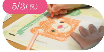
5/3(祝) KOWAZA ぬり絵ぼち袋ワークショップ