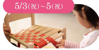
5/3(祝)~5(祝) 広松木工株式会社 いすをつくらう