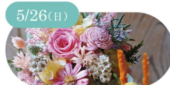
5/26(日) flower shop parc フレッシュからドライになる アレンジメント