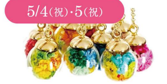
5/4(祝)・5(祝) atelier nolla/篠田はるか お花のネックレスをつくらう