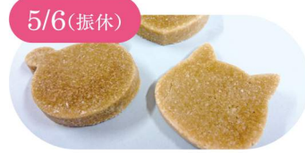
5/6(振休) まるは油脂化学株式会社 手作り石けん教室