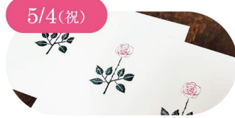
5/4(祝) 後藤ガリ版印刷所 ガリ版体験 バラのカードをつくらう