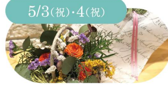
5/3(祝)・4(祝) IRISE バスケットアレンジ/リース