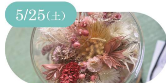
5/25(土) TOKOLO アンティーク調ガラスドーム