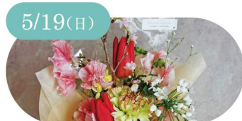
5/19(日) atelier rurula 韓国風ブーケ