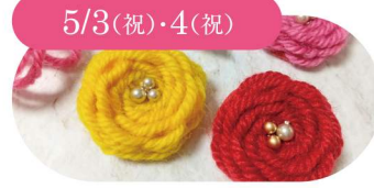
5/3(祝)・4(祝) Eri-kari ふわふわバラ刺繍/バラ刺繍ブローチ