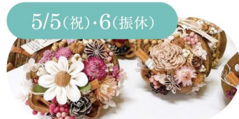
5/5(祝)・6(振休) Makana noheA ドライフラワーアレンジ