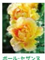
ポール・セザンヌ